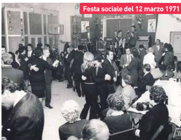
Festa sociale del 12 marzo 1971

Gli esponenti delle commissioni territoriali in carica sono a disposizione per tutte le informazioni e per soddisfare le curiosità che riguardano eventuali richieste, modalità di adesione, com'è configurata la struttura organizzativa, i tempi, le correlazioni e così via. Sarà possibile, perciò, convenire con loro puntando insieme a dedicare una piccola parte del proprio tempo per un atto esemplare di responsabilità sociale.